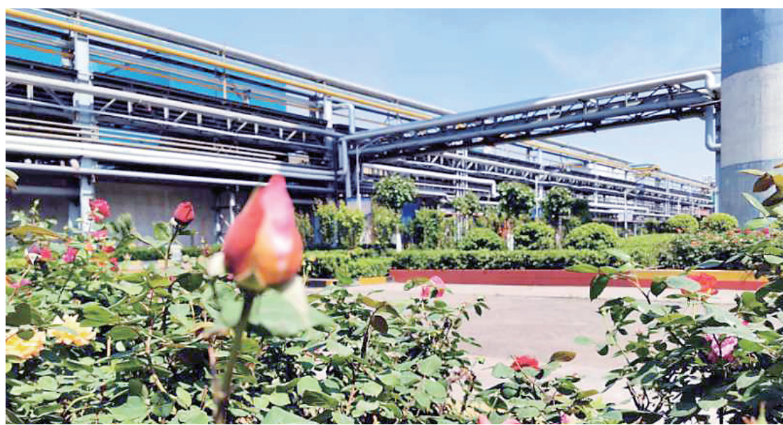
含苞怒放 天津天钢联合特钢公司 张芳摄

对于阅读，我不是单纯地怀旧，也不是刻意去诋病任何新的阅读方式，虽然在社交网络时代，阅读正逐渐从一个独立、个体的行为变得更加社交化、功利化。但作为一个读书人，总该不与流俗妥协；否则，与其浪费了读书的那点儿时间，倒不如去做点儿其他的活计。