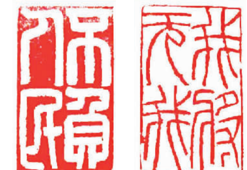
不负人民 我将无我 天津理工大学 田广钧 治印