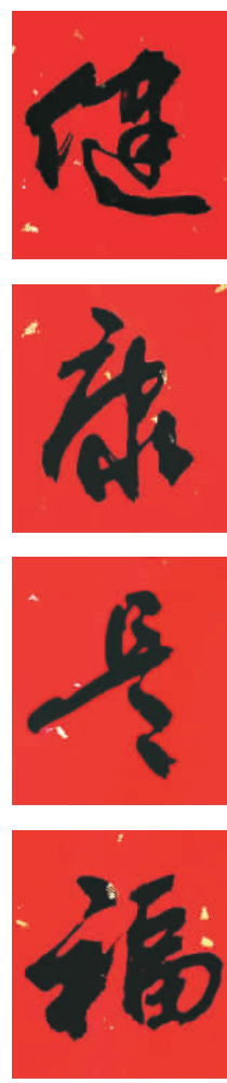
书法 河东区富民路街 李志明 作