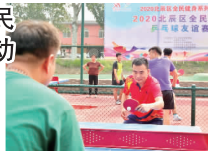
居民在刚刚开放的公园内进行乒乓球运动。

栖凤体育文化公园于2019年9月开工建设，占地面积约26000平方米，体育场地占地面积6000平方米，大张庄镇人民政府投资600余万元用于提升公园基础设施，打造整体绿化。公园内设有智能健身步道、五人制笼式足球场、多功能运动场等，其中乒乓球桌、羽毛球桌、儿童游乐区、智能健身器材为天津市体育局争取转移支付专项资金投资建设。该公园建成后补充了北辰区大张庄示范