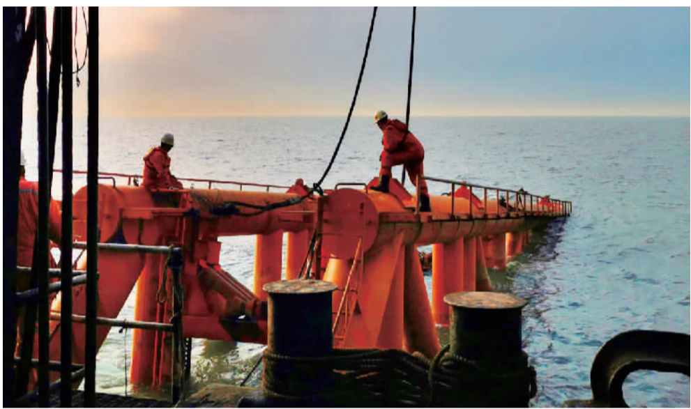
“双战双胜”，海上施工生产忙