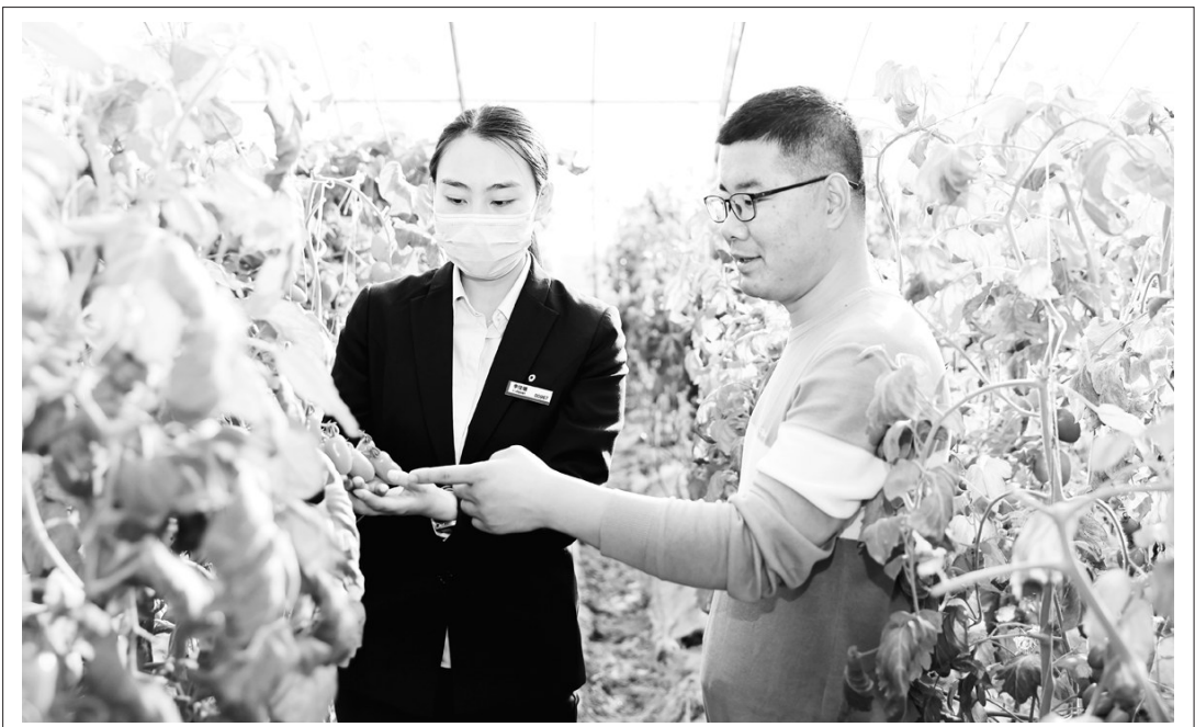
去年以来,建行衡水分行以“党建”为纽带和桥梁,以“党员”身份为信用背书,通过“党建+信用+裕农通”新体系发放党建惠农贷款,通过裕农通平台优化金融服务,以新金融行动为村民解决了生产经营后顾之忧。2021年,该行以“党建信用”为依托,累计为4682户“信用户”提供信贷资金支持14365万元。图为建行衡水分行员工走进乡村大棚种植基地,实地了解农户需求。

“智慧微贷”系统的正式上线运行,标志着枣强农商银行信贷业务改革迈上新台阶,成为该行信贷业务发展史上的一座重要的里程碑,为实现枣强农商银行稳健合规发展奠定了更加坚实的基础。